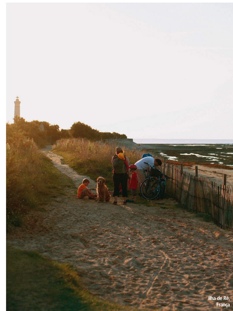
Ilha de Ré, França

Ilha de Ré – Manuel Gomes da Costa, Alasca – Paul Soudiers/Getty Images